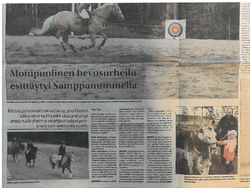
Kuva 4: Lehtileike Laitilan hevosmessuilta Laitilan sanomat 7.5.2019