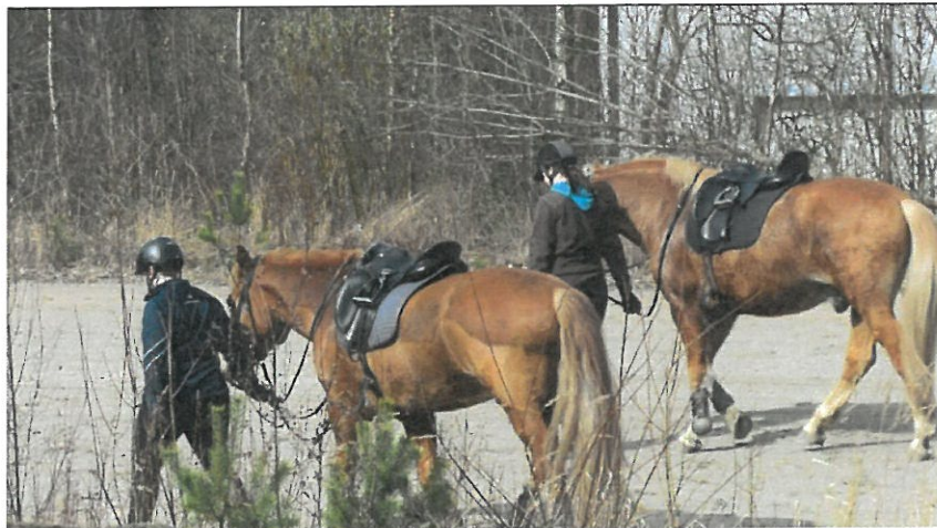
Kuva 3: ratsukoita raviradalla

Yhdistyksen toiminta ei ole ollut vain "itsekästä omien etujen ajamista." Ravirataa on käytetty myös moniin muihin harrastuksiin niin erikseen sovittaessa. Rataa on käytetty Laitilan Jyskeen nuorison maastajuoksutreeneihin erityisesti kevään rospuuttoaikaan, kun muut harjoittelupaikat ovat olleet vielä käyttökelvottomia. Rataa on käytetty greyhound koirien juoksuharjoitteluun greyhound harrastajien toimesta. Raviradalla on järjestetty useita koiranäyttelyitä sekä muita koiratapahtumia. Paviljonkia on vuokrattu sekä kylä-yhdistysten käyttöön kuin myös tanssikurssien pitopaikkana. On tila vuokrattavissa myös juhlienkin pitopaikaksi.